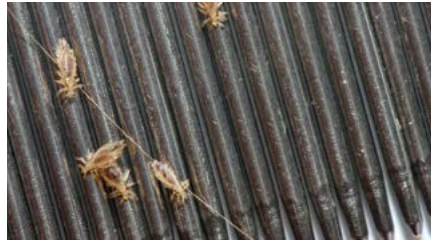
Hoofdluizen op een kam.

Hoofdluis veroorzaakt meestal jeuk, maar niet altijd. Het is aan te raden uw kind regelmatig op hoofdluis te (laten) controleren. Als u het haar met een fijntandige kam doorkamt boven een vel wit papier, kunt u zien of er luizen uit vallen. Het zijn grijsblauwe of, nadat ze bloed opgezogen hebben, roodbruine beestjes van een paar millimeter groot. Hun eitjes, neten, zijn witte stipjes die op roos lijken. Alleen zit roos los terwijl neten juist aan het haar vastkleven.